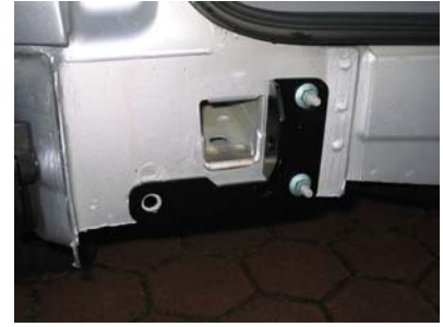
Montagepunkte links hinten