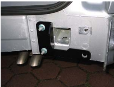
Montagepunkte rechts hinten