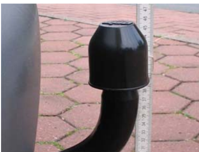
Fahrzeug von der Seite