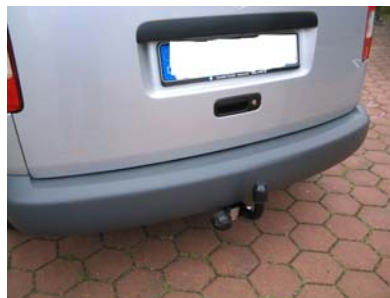
Fahrzeug von hinten