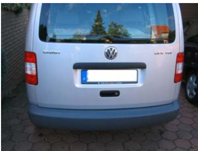
vor der Montage