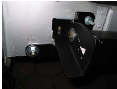
Montagepunkte links hinten