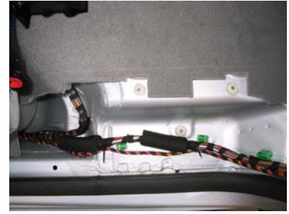
Kabelverlegung Schweller links