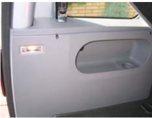
Ausbau Seitenverkleidung links