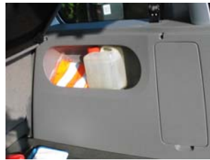
Ausbau Seitenverkleidung rechts