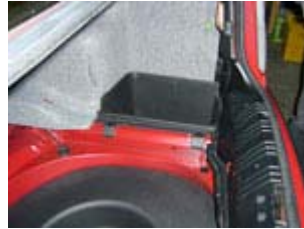
Ablagefach rechts, Heckblechverklei- dung