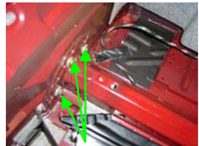
Demontage Stoßfänger Kofferraum rechts 3 Muttern