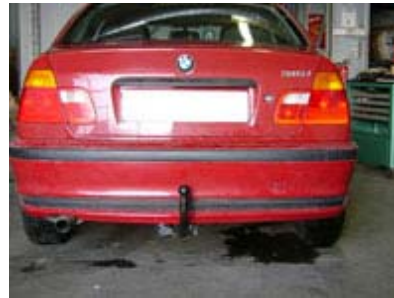
Fahrzeug von hinten