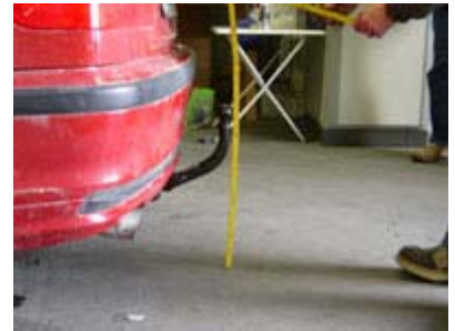
Fahrzeug von der Seite