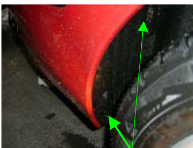
Demontage Stoßfänger links, 1 Plastikclip, 1 Schraube