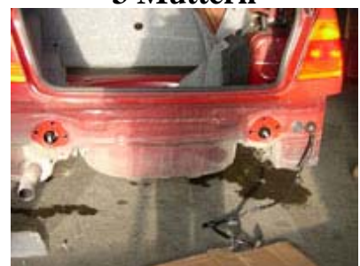
Fahrzeug ohne Stoßfänger