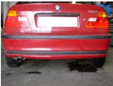
Fahrzeug vor dem Einbau