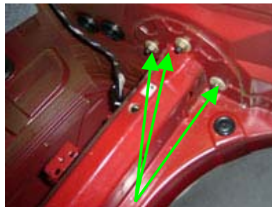
Demontage Stoßfänger Kofferraum links 3 Muttern