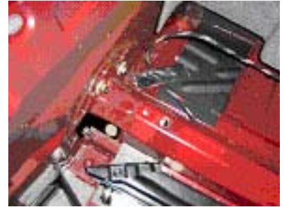
Montagepunkte Kupplung rechts